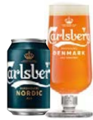
CARLSBERG NORDIC ALE

Alkoholprocent: 0,5 33 cl fl, 33 cl ds 20 l MD