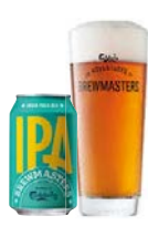
BREWMASTERS INDIA PALE ALE

Brewmasters Collection India Pale Ale er en ravgylde ale med en frisk humleduft, en velbalanceret smag og en god efterbitterhed.