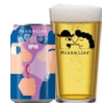
MIKKELLER BURST IPA

Frugtig IPA, frisk citrus aroma og smag af grapefrugt og appelsinskal.