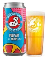
BROOKLYN PULP ART

Brooklyn Pulp Art IPA, er en hazy IPA. Duften er præget af tropiske citrusfrugter, og smagen er frisk, med noter af citrus og mango.