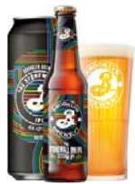
BROOKLYN STONEWALL INN IPA

Humleluften byder på referencer til citrus, ananas & mango, og mundfornemmelsen er blød mens smagen domineres af en afstemt frisk, mild og humlet bitterhed.