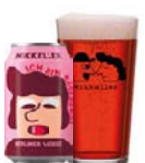
MIKKELLER ICH BIN RASPBERRY

Berliner weisse med noter af modne hindbær.