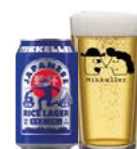
MIKKELLER JAPA- NESE RICE LAGER

Let og klar pilsner, beriget med subtile noter af kokos og lime.